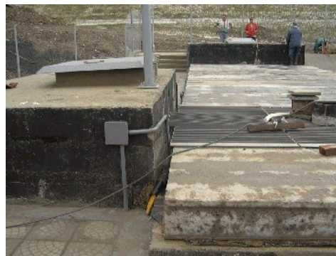
2. Събирателна шахта инфилтрат