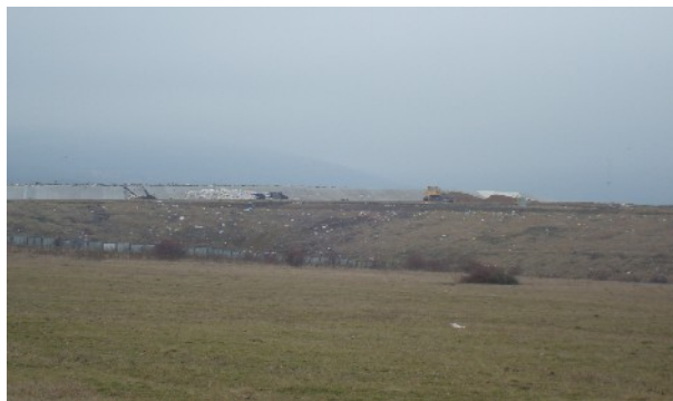
1. Общ изглед на депо кв. Суходол